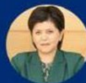
Гаухар Бурибаева Председатель Правления АО «Фонд развития предпринимательства «Даму»