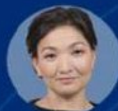
Лаззат Рамазанова Депутат Мажилиса Парламента Республики Казахстан